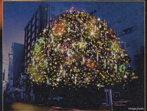
スズラン前 タブの木広場