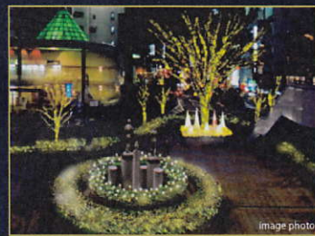
高崎駅西口駅前広場