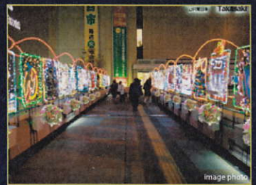
ペデストリアンデッキ