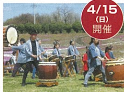
箕輪城太鼓保存会

準備完了後、配布場所の案内放送をいたします。放送後先着順とさせていただきます。 ※入場順ではありません。