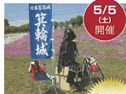
兜と陣羽織の試着体験