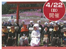
みのわの里のきつねの嫁入り出前行列