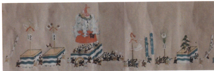
頼政神社例大祭絵巻の一部