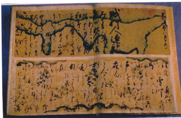
諸大家連歌帖(県重文)