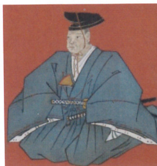
大河内輝貞公官服図