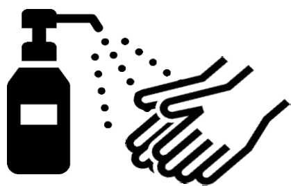
手指の消毒をする