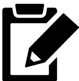
申告書を記入する