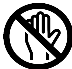
展示物、ガラスケース、 壁にさわらない