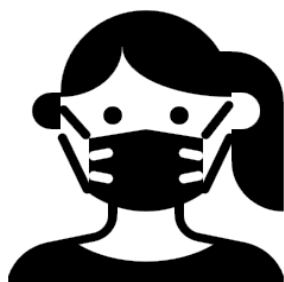
マスクを着用する