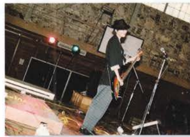
高校時代 バンドのライブ

本展では、書簡をはじめ、自筆資料や所蔵品等を展示し、土地で生きる人々を描く絲山秋子の軌跡と幅広い活動を紹介します。ロングインタビュー「絲山秋子氏に聞きたい10の質問」や初出し写真も必見です。魅力に満ちあふれた上質な絲山文学をご堪能ください。