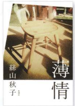
『薄情』 2015年12月 新潮社