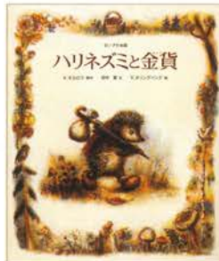
『ハリネズミと金貨』 作：ウラジーミル・オルロフ 絵：ヴァレンチン・オリシヴァン 文：田中 潔 / 2003年 / 偕成社