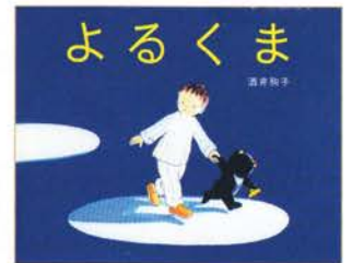
『よるくま』 作・絵：酒井駒子 1999年 / 偕成社