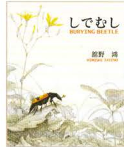
『しでむし』 作・絵：館野 鴻 / 2009年 / 偕成社