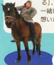
『世界のともだち5 モンゴル』 (写真：清水哲朗)より

偕成社は1936年創業の子どもの本の出版社。『はらぺこあおむし』や「ノンタン」シリーズなどの人気作品を手がけるほか、わらべうた、障がいへの理解を深める本など、時代に先駆けたテーマの絵本や児童書を作り続けてきました。社名の「偕成」には「偕に成る」、読者と偕に出版社も一緒に成長していくという想いが込められています。