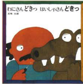
『わにさんどきつ はいしゃさんどきつ』 作・絵：五味太郎 / 1984年 / 偕成社