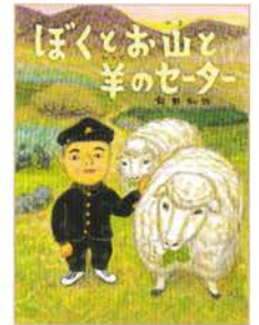
『ぼくとお山と羊のセーター』 作・絵：飯野和好 / 2022年 / 偕成社