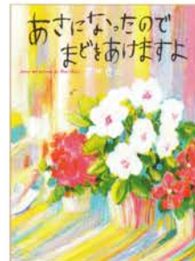
『あさになつたのでまどをあけますよ』 作・絵：荒井良二 2011年 / 偕成社