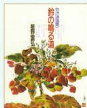
『花の詩集 鈴の鳴る道』 著：星野富弘 1986年 / 偕成社